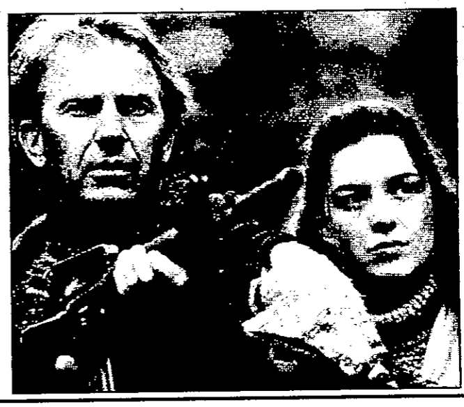
اوليفيا وليامز في مشهد من مساعي البريه مع كيفن كوستنر